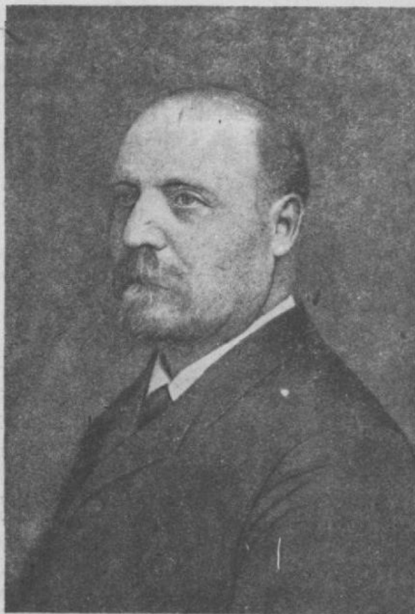
А. А. Белопольский (1908 г.)

Надо отметить еще одну особенность, именно: А. А. с детского возраста увлекался мастерством. Видимо, у него были, как говорится, золотые руки. Он имел большие способности к механике, так что одно время родители намеревались отправить его за границу для поступления в техническое учебное заведение (ему в то время было около 14 лет), именно в силу его пристрастия к механике. Он с трудом упросил родителей позволить ему окончить гимназию, в которой он учился.